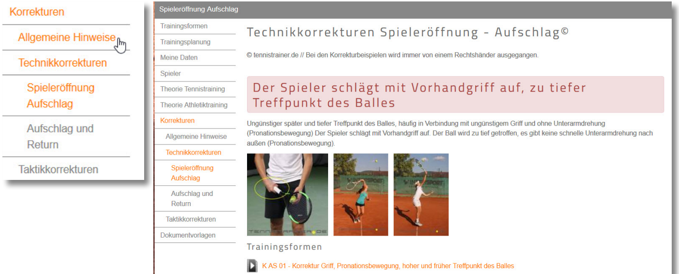
52. Abb.: Als neues Thema wurde 12/2018 der Bereich „Korrekturen“ in tennistrainer.de eingebaut

Im neuen Bereich Korrekturen haben wir in zwei Theoriekapitel wichtige Inhalte zum Thema Technik- und Taktikkorrekturen aufgenommen.